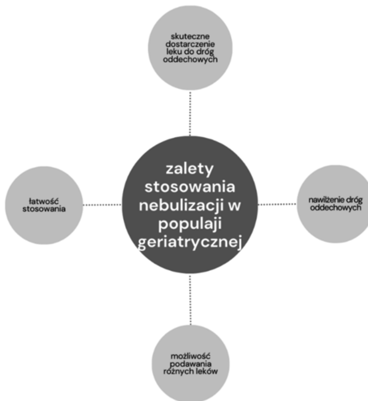
Rycina 1. Zalety stosowania nebulizacji u osób starszych

Możliwość podawania różnych leków: Nebulizacja umożliwia podawanie różnych rodzajów leków, takich jak leki przeciwzapalne, rozszerzające oskrzela, leki mukolityczne czy antybiotyki, w zależności od potrzeb pacjenta. Dzięki temu może być wykorzystana w leczeniu